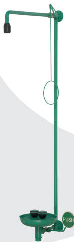
BRU 867 085