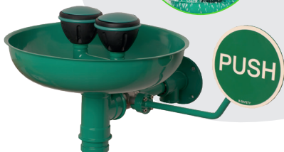
BRU 300 085