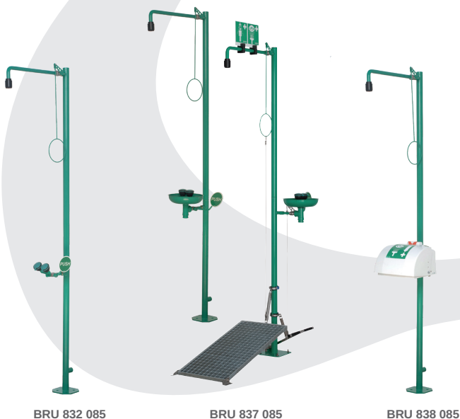
BRU 832 085