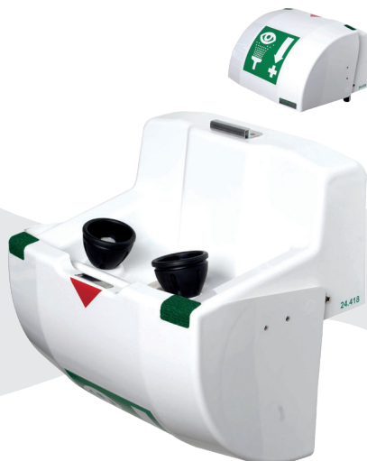
BRU 850 005