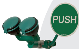
BRU 210 085