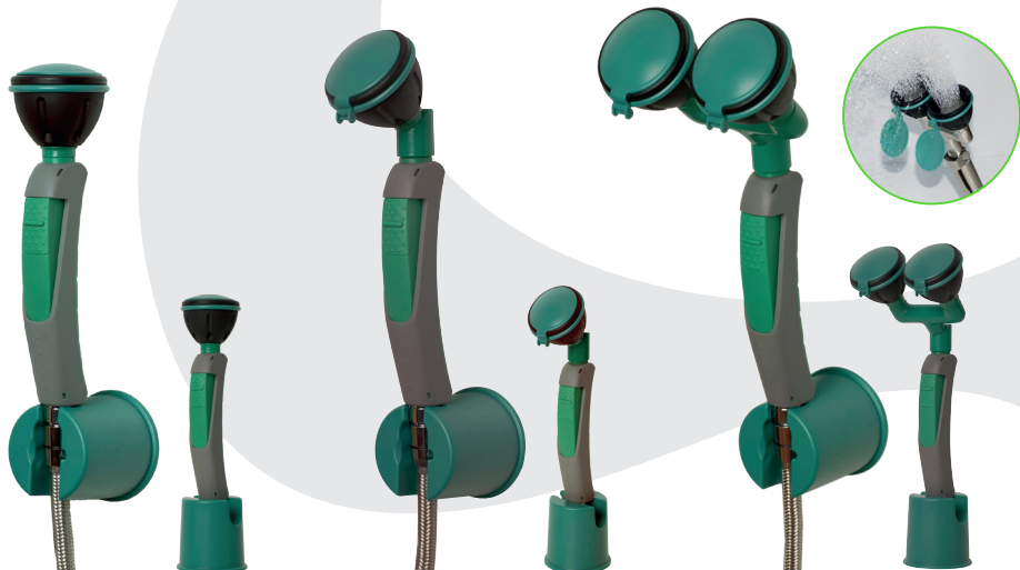
BRU 712 025